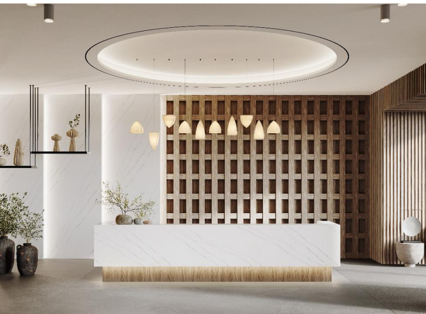
HIMACS in Aurora Calacatta Fiore

Quando è richiesto un effetto marmo che si distingua, Aurora Calacatta Fiore è la scelta perfetta grazie alle sue venature lunghe e fluenti e al morbido colore bianco. Semplice e ricercato, si abbina perfettamente ad arredi cucina opachi o in legno naturale. Un'alternativa a bassa manutenzione e sempre riparabile al vero marmo: questa tonalità crea, infatti, lo stesso aspetto esclusivo ma è più facile da curare, fabbricare e installare.