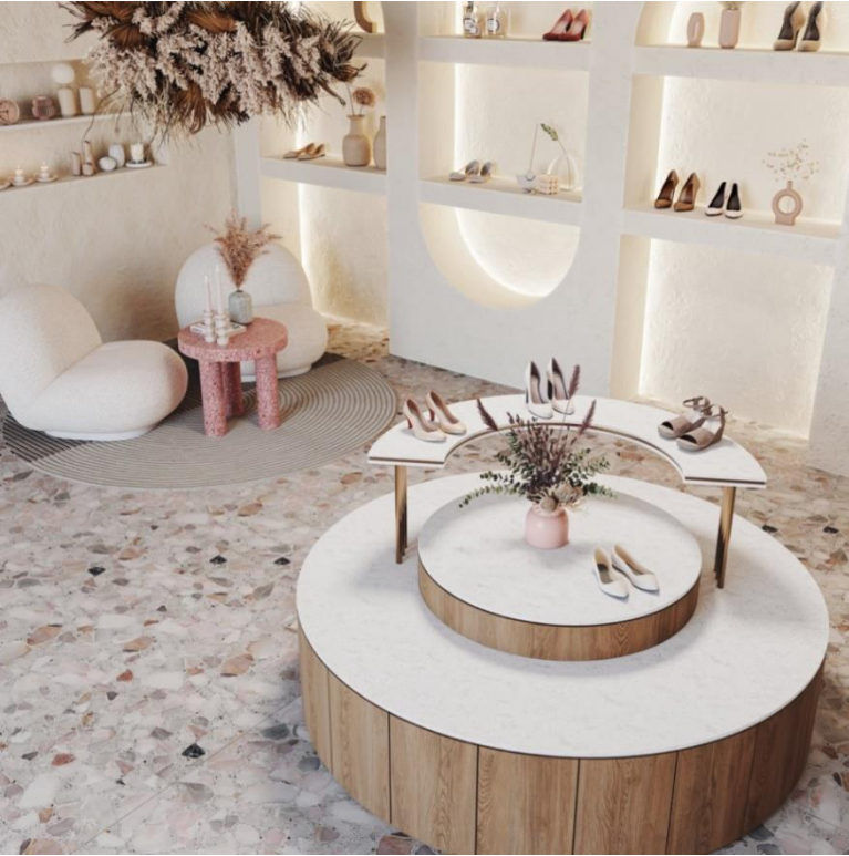
HIMACS in Gravilla Snow

Gravilla Snow presenta un elegante design “off-white” caratterizzato da venature morbide; la sua estetica delicata si adatta perfettamente a ogni tipologia di ambiente, valorizzando arredi, complementi ed espositori commerciali, conferendo un aspetto ricercato. Il suo DNA sofisticato è indicato per cucine di grandi e piccole dimensioni, ed è perfetto per dare un effetto di maggiore spazio ad ambienti più ristretti e contenuti.