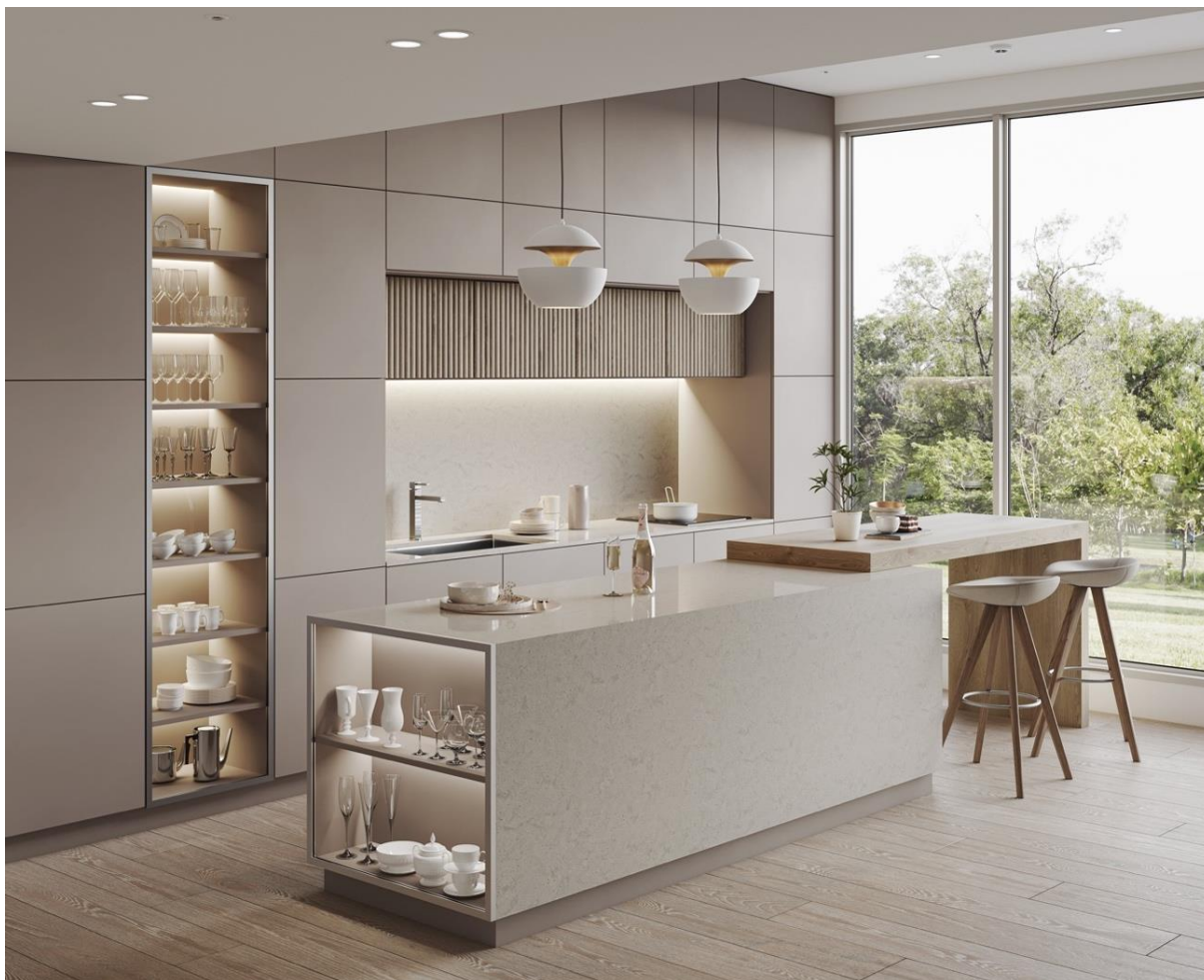
HIMACS in Gravilla Cream

Due dei nuovi colori fanno parte della nuova collezione Gravilla , mentre altre due tonalità arricchiscono la fortunata gamma Aurora & Marmo .