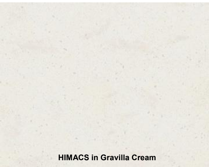
HIMACS in Gravilla Cream

Gravilla Cream ha uno stile più ricco, con delicate “particelle” crema, perfette per dare profondità e una sensazione di calore ad ambienti freddi. Ideale per isole cucina, superfici di lavoro, rivestimenti e piani per stanze da bagno, questa tonalità si abbina a tutti gli stili di interior design con il suo effetto rilassante. Questa tonalità calda è indicata anche per uffici, hotel e interni di locali commerciali, offrendo una finitura di alta qualità ad aree reception e open space.